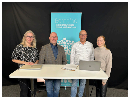
Barnafrids medarbetare vid lansering av resurssidan för barnskyddsteam 2025.

Resurssidan samlar kunskapsstöd om sexuellt och fysiskt våld, omsorgssvikt, medicinskt orsakad barnmisshandel och hälsa bland barn i samhällsvård. Den innehåller även stöd för dokumentation och kodning inför övergången till ICD-11. Initiativet är en del av det myndighetsgemensamma arbetet för att främja sexuell och reproduktiv hälsa och rättigheter.