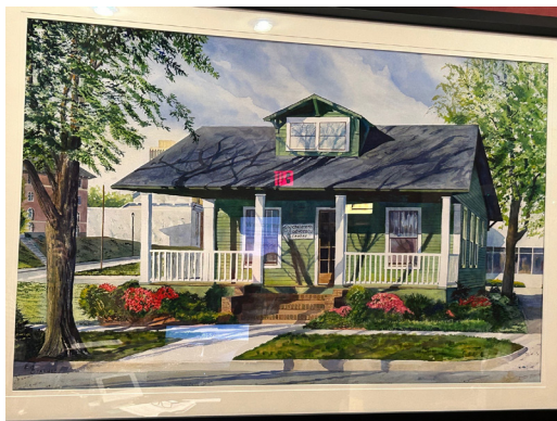
Första barnahuset startades i Huntsville, USA, 1985.

Det EU-finansierade projektet TICANDAC, som Barnafrid drivit tillsammans med universitetet