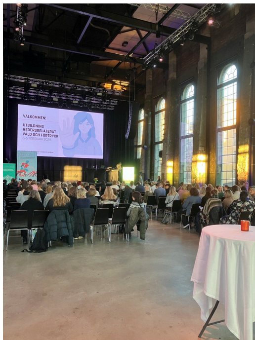
Utbildningsdagar om hedersrelaterat våld och förtryck för barnahus i Värme kyrkan i Norrköping 2025.

registrerade användare på basprogrammet.